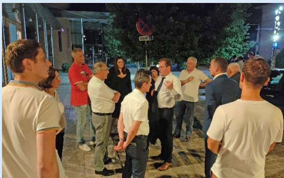
Inauguration de la rénovation LED++ à Eaunes

✓ 6 M€ d'économie annuelle sur les dépenses d'énergie des communes